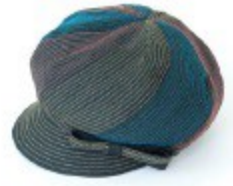
〈ベル・モード〉 キャスケット 42,120円

昔ながらの製法の日本製の金具を使用。通常の2枚金具より内装のバランスを取る必要があるため、がま口専門の職人技で口金が付けられます。