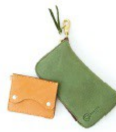
〈バーリー〉 iPhoneケース 5,724円(全6色) バスケース 3,888円(全6色)

世界遺産である屋久杉を薄く細く切ったものを編み上げた生地と、日本でなめした革を組み合わせるオリジナリティあふれる技法で仕上げたバッグや財布。