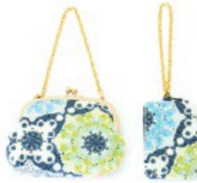
〈シェリール〉 がま口 20,520円 バスケース 10,260円

1枚革仕立てにすることで、ものを入れ、持ったときに生まれる生地のような美しいドレープ感を追求。財布も収納した際の美しさにこだわっています。