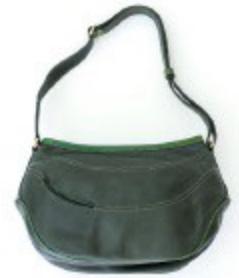
〈フラソリティ〉 ショルダーバッグ 38,880円(オリーブ、他2色)

日本ではほぼ(バーリー)でしか扱えないといえる、柔らかで丈夫なエルク革。熟練の縫製技術により、扱いづらい厚手の素材を見事に生かしています。