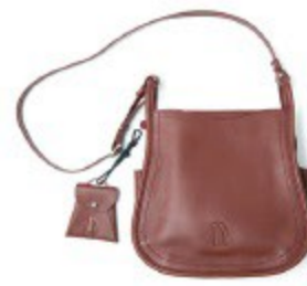
〈中澤靴〉 ショルダーバッグ 27,300円

ビーズ刺しゅうを施したがま口とバスケース。ビーズを敷き詰めるのではなく、あえて生地の部分を残すことで自然な立体感を生み出しています。