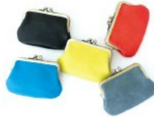
〈野村製作所〉 三枚がま口 各4,320円(全10色)

本革製でありながら軽さを出し、見えないところにひと手間かけて、実用性とことん追求する技が生きた、持ちやすく美しいバッグです。