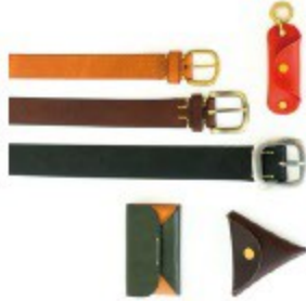
〈ゾディアック〉 ベルト(上) 8,100円(全3色) (中) 8,100円(全3色) (下) 9,180円(全3色) キーケース 4,860円(全8色) カードケース 7,560円(全8色) コインケース 3,240円(全8色)

植物タンニンなめしを施した1枚革で作るレザーグッズを展開。長年の使用に耐え、使い込むほどに色艶の味わいが増すエイジングが楽しめます。