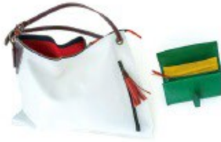
〈エムリップル〉 バッグ 49,680円(白、他2色) 財布 45,360円(全6色)

1枚革仕立てにすることで、ものを入れ、持ったときに生まれる生地のような美しいドレープ感を追求。財布も収納した際の美しさにこだわっています。