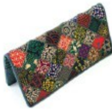
〈江戸三紅印傳〉 うず型長財布 25,920円

印伝を作るには鹿革に本漆を引き模様を描くという熟練の技が必要とされます。細かく切った印伝をつなぎ合わせてパッチワークする技も貴重です。