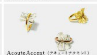
AcouteAccent (アキュートアクセント)