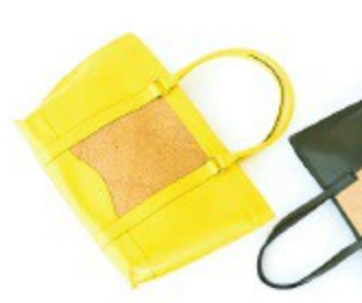
〈キアミ〉 トートバッグ(大) 64,800円(全3色) トートバッグ(小) 48,600円(全3色)

植物タンニンなめしを施した1枚革で作るレザーグッズを展開。長年の使用に耐え、使い込むほどに色艶の味わいが増すエイジングが楽しめます。