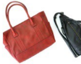
〈アッズーニ〉 馬革トートバッグ 38,880円(レッド、他2色) やぎ革ボディバッグ 25,920円(ブラック、他1色)

印伝を作るには鹿革に本漆を引き模様を描くという熟練の技が必要とされます。細かく切った印伝をつなぎ合わせてパッチワークする技も貴重です。